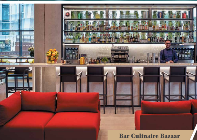
Bar Culinaire Bazaar