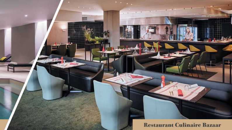
Restaurant Culinaire Bazaar