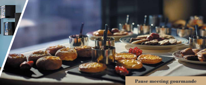
Pause meeting gourmande